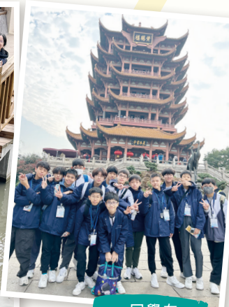
同學在 黃鶴樓合照

為了讓學生認識武漢及赤壁的歷史和文化，明白愛護及傳承中華文化是國民應有的責任，中二級學生於2024年11月19至22日參與「武漢、赤壁歷史文化及自然科學探索之旅」。是次交流團的活動包括：參訪三國赤壁古戰場、辛亥革命武昌起義紀念館、武漢大禹文化博物館等，可加深學生對國家的歷史文化、風俗特色、文物保育等方面的認識。