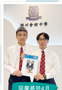
同學將於4月 出國比賽

同學於2024年12月21日參與了「日內瓦國際發明展」，並在香港區選拔賽中勝出，將於在2025年4月9至13日前往瑞士日內瓦代表香港參賽，與各地發明家交流。