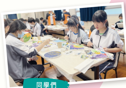
同學們認真作繪畫。

本校中四級學生於全方位學習周參加了肌理畫工作坊。這次活動以其獨特的創意和深刻的藝術體驗，成為學生們課堂外的重要收穫。在此次工作坊中，藝術導師深入講解了肌理畫的各種技巧，並指導學生們如何將砂沙與顏料混合，藉由油畫刀創作出充滿質感的風景油畫。整個過程中，學生們不僅學習到新的藝術技法，更在實際操作中激發了創意。參加的學生表示，這次活動讓他們對肌理畫有了更深刻的理解，對於以後的藝術學習和創作充滿信心和期待。大家都對自己的創作感到自豪，並通過作品交流分享彼此的靈感和理念。