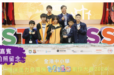
同學與嘉賓 在比賽後拍照留念

我校學生參加了在2024年11月30日舉行，由南屯門官立中學及中華基督教會扶輪中學合辦的「全港中小學環保風力發電機 STEAM 創作大賽 2024（中學組）」，是次比賽目的是希望讓參賽同學能以實踐環保及創新的STEM精神，自行設計或組裝簡單的風力發電機。參賽同學在比賽前積極備戰，在老師指導下，屢次改良設計，不斷改進，最後奪得校際總殿軍。