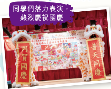
同學們落力表演 熱烈慶祝國慶

本校龍獅隊有幸獲邀於【喜迎中華人民共和國成立75周年暨香港回歸祖國27周年】龍的傳人——沙田區青年匯演中作表演嘉賓，一同感受中華人民共和國成立75周年的喜悅。