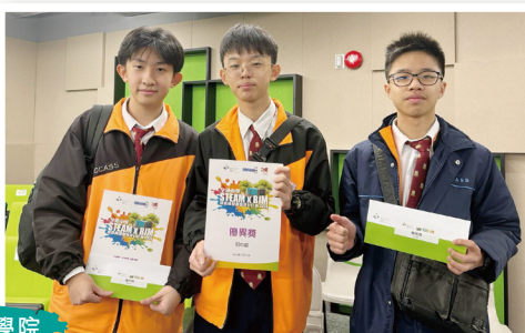
同學在香港建造學院 獲頒發獎項

本校同學在12月14日參與了由香港建造學院舉辦「全港中學 STEAM x BIM 建造模型創意設計比賽 2024 - 你想 GLAMPING」。同學在比賽中參與學院的工作坊，並在學院導師的指導下，學習 BIM 建築訊息模擬軟件，融入「組裝合成」建築法 (MiC)，設計出 Glamping 主題作品，並以 3D 打印原型。同學們在活動中喜獲初中組及高中組優異獎項。