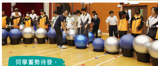
同學蓄勢待發，為活動做好準備。