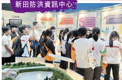
同學參觀 新田防洪資訊中心

本校中四級修讀地理科的同學，分別於11月12日，到「新田防洪資訊中心」參觀。透過不同的導賞活動，加深同學對香港水浸的成因和政府防洪策略的認識。同學先參觀「新田防洪資訊中心」，再到元朗排水繞道、人工濕地及南生圍實地考察。生態導賞員的講解，讓同學對香港的河道治理工程、防洪理念及河道生態有更清楚的認識。