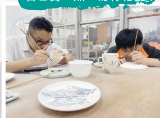
同學精心設計 自己獨一無二的青花瓷

為讓學生欣賞中華文化，學習運用釉下彩技法在白瓷的素坯上繪畫，並創作出個人的青花瓷或釉下彩作品，中國歷史科於2024年10月28日帶領中五級修讀中史科的學生學習青花瓷繪。學生把中國傳統水墨畫及現代流行的圖案和青花繪畫相融合，充分地融合中華傳統文化及現代的潮流。