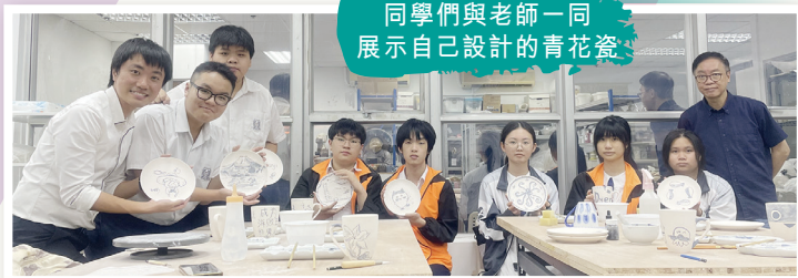
同學們與老師一同 展示自己設計的青花瓷

為讓學生欣賞中華文化，學習運用釉下彩技法在白瓷的素坯上繪畫，並創作出個人的青花瓷或釉下彩作品，中國歷史科於2024年10月28日帶領中五級修讀中史科的學生學習青花瓷繪。學生把中國傳統水墨畫及現代流行的圖案和青花繪畫相融合，充分地融合中華傳統文化及現代的潮流。