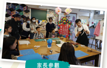
家長參觀 學校特別室