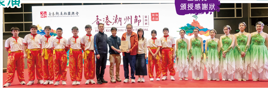
主辦方頒授感謝狀。