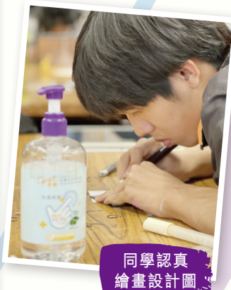
同學認真繪畫設計圖。