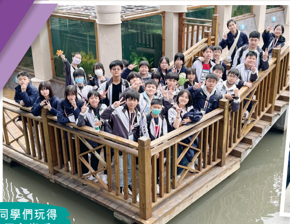
同學們玩得 不亦樂乎