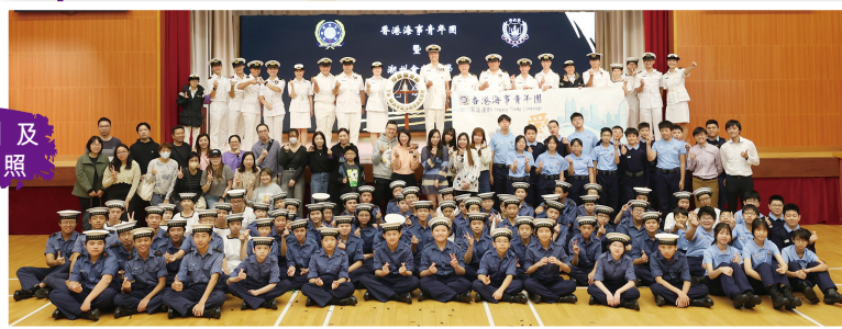
「潮航號」及 各嘉賓合照