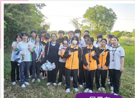
同學在 南生圍合照