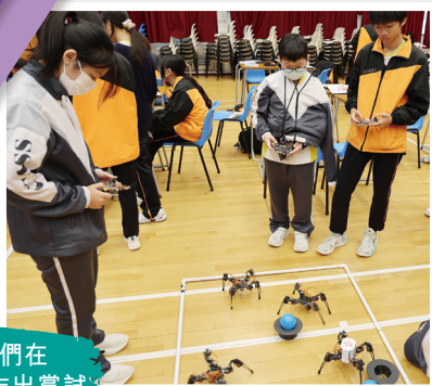
同學們在 編程後作出嘗試

全體中三級同學於全方位學習週（11月21日）參加了四小時的 STEAM 多足機械人工作坊。活動從學習牛頓力學開始，再組裝機械人、接合零件、設計外衣及編寫程式，並進行操控測試，充分體現了科學、科技、數學、工程的精神，透過動手進行學習 (Learning by doing)。最後，三十組同學進行了激烈的多足機械人比賽，展現了他們的創意與技術，經歷了一段愉快而充實的 STEAM 學習旅程。