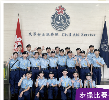
步操比賽後 大合照

民安隊於2024年9月8日在民安隊總部舉行少年團挑戰日2024，以中式步操形式作賽，旨在強化青少年的國家觀念及國民身份認同。是次比賽由逾200名少年團員組成的10支隊伍參與。本校亦有7位少年團員參與比賽，並獲得亞軍的佳績。