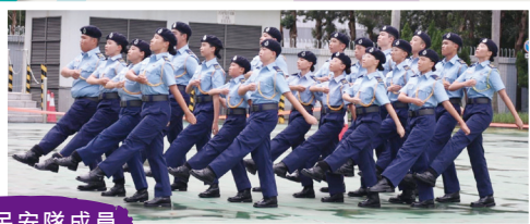
民安隊成員 進行步操