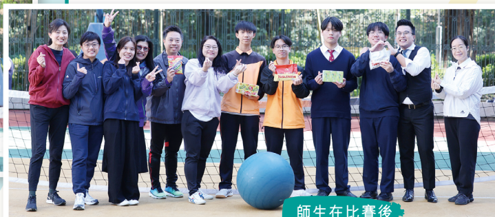
師生在比賽後 一同合照