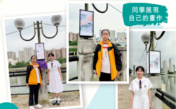
同學展現 自己的畫作