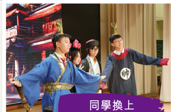
同學換上 中國古代服飾留影