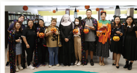
家長們與老師 一同合照留念