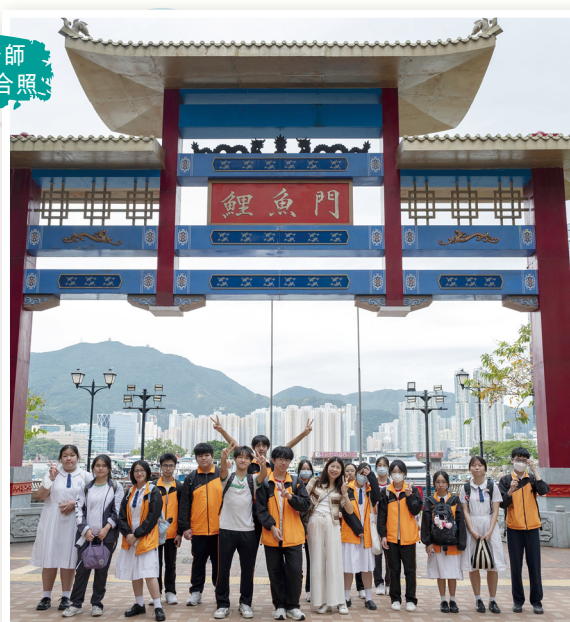
同學與老師 在鯉魚門合照