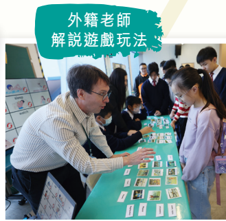
外籍老師 解說遊戲玩法