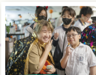
同學們與 家長樂在其中

我校圖書館與英文科合辦「午間萬聖節活動」，同學於萬聖節當日透過玩遊戲及借閱圖書，便可獲得第八款欣賞卡及萬聖節小禮物。除此之外，當日亦有老師、同學及家長義工派發萬聖節糖果，增加節日氣氛。