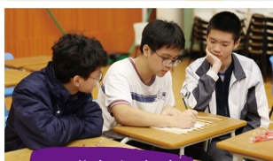
同學們努力地 解開遊戲難題