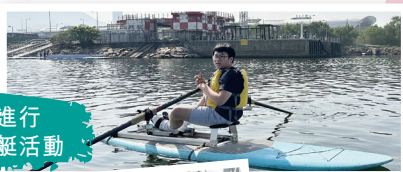
同學進行 平板賽艇活動

本校新界東第1210旅童軍成員，於2024年11月至12月期間，參加為期5天之童軍平板賽艇訓練班。訓練班分別於觀塘避風港及啟德區之維多利亞港水域進行。各童軍成員都能掌握基本之平板賽艇技巧及享受海上活動之樂趣。