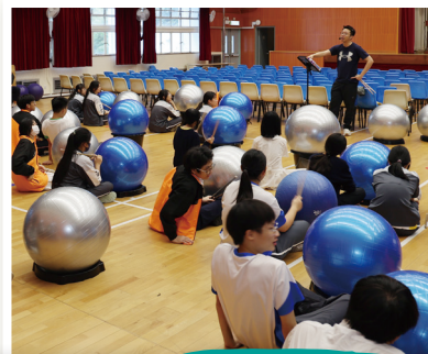
活動開始前，導師為同學講解玩法。

本校中四級學生於全方位學習周參加了運動敲擊小組。這次活動為同學們帶來一個更加豐富且創新的運動體驗。在這次小組中，學生們參與了多種節奏遊戲和創意敲擊樂器的使用，學習了入門基本節拍及韻律技巧。這些活動不僅增加了動感和趣味性，還鼓勵學員在輕鬆的氛圍中進行低強度的有氧運動，進而促進心肺功能的提升。透過不同的節奏遊戲，學生們的專注力和反應能力得到了有效提高。這些活動讓同學們在運動過程中，發揮創意的同時，也改善了身體狀況，體會到了運動的樂趣。