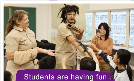
Students are having fun with the blue tree monitor!

Check out our gallery for photos of our students in action and stay tuned for more exciting learning adventures in the future!