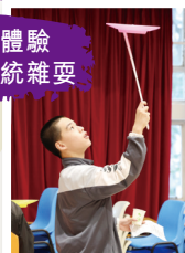
同學體驗 中國傳統雜耍

為了加深同學對中華文化的認識，中文科與中國歷史科共同協作，於2024年12月09日至12月13日舉辦「中華文化周——古代文化生活」。同學透過參與具有古代生活特色的攤位遊戲（例如漢服體驗、香包及陀螺製作、彩虹書法、騎馬射箭等等），加深認識我國文化特色。此外，中華文化周亦在周會時段為全校同學舉辦「雜耍表演」。同學從遊戲和觀賞表演中認識古代人在日常生活中將藝術與實用性展現出來，並學習欣賞當中的創新精神及智慧，並予以傳承和發揚。