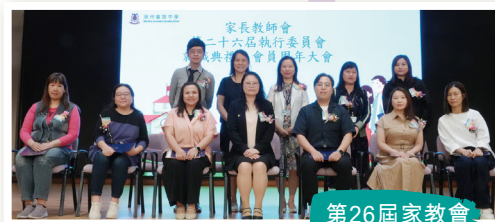
第26屆家教會 就職典禮