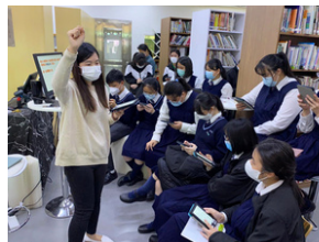
九龍塘學校（中學部）讀書會