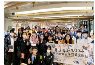
七校合辦圖書館管理員交流日